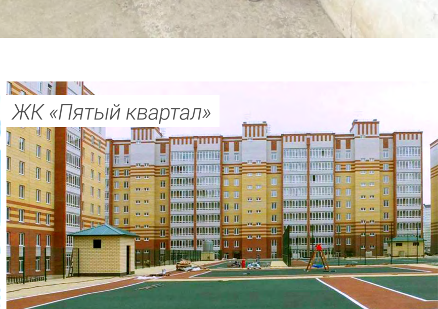
ЖК «Пятый квартал»