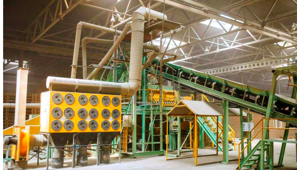
Цеха предприятия оснащены системами воздухоочистки и пылеулавливания