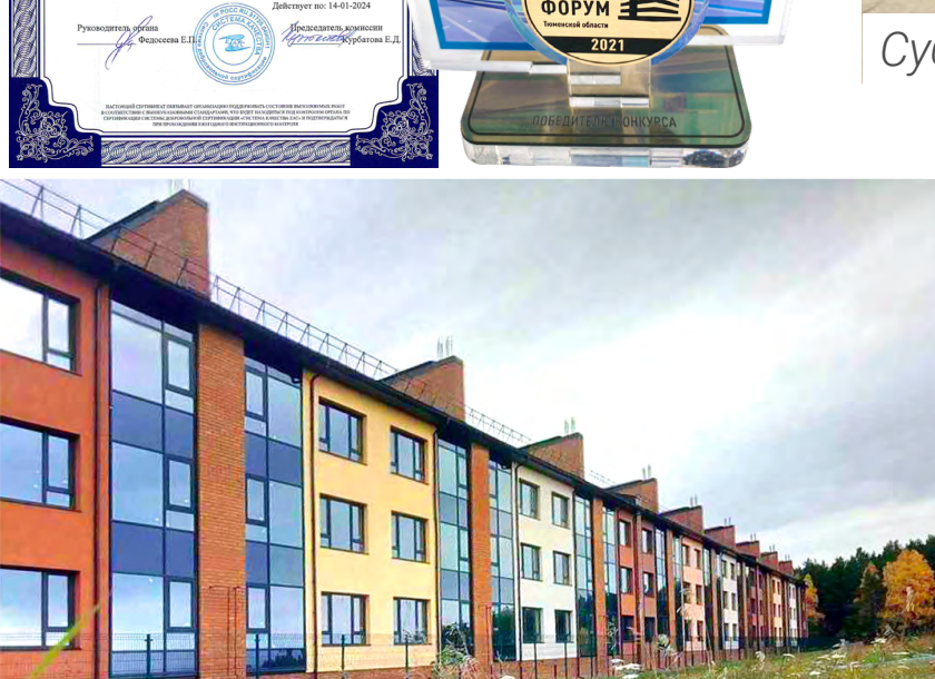
ЖК «Комфорт клуб»