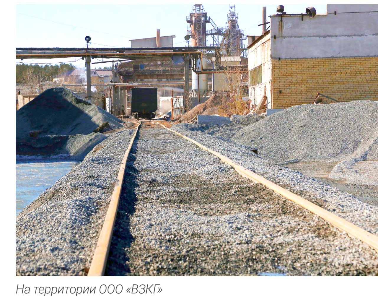
На территории ООО «ВЗКГ»