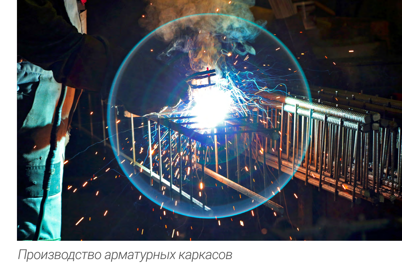
Производство арматурных каркасов

К концу 2020 года на всех рабочих местах проведена оценка профессиональных рисков. На вновь организованных рабочих местах проводится оценка профессиональных рисков и специальная оценка условий труда. Составлены мероприятия по снижению имеющихся профессиональных рисков и планомерно идет их выполнение.