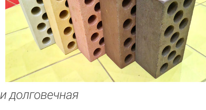
Продукция ВЗКГ — прочная и долговечная