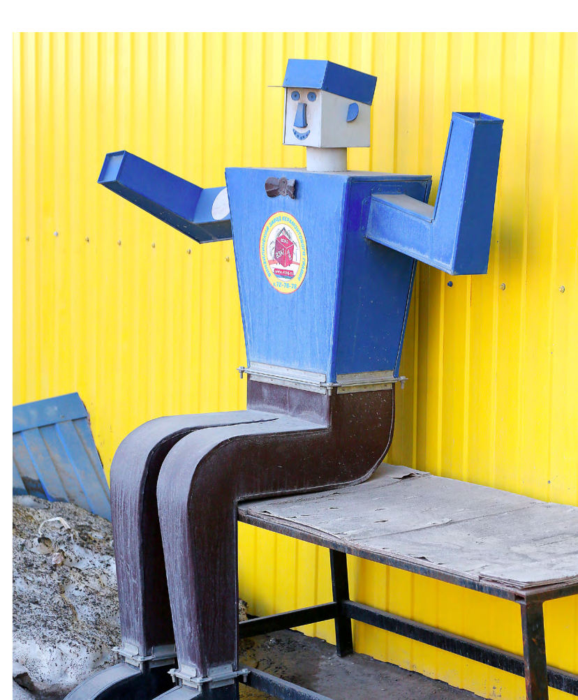
Талисман цеха металлоизделий «Железный Вася»