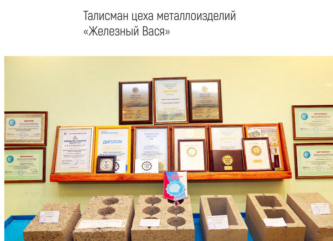
Выставочный зал продукции ООО «ВЗКГ». Новинки изделий цеха блоков