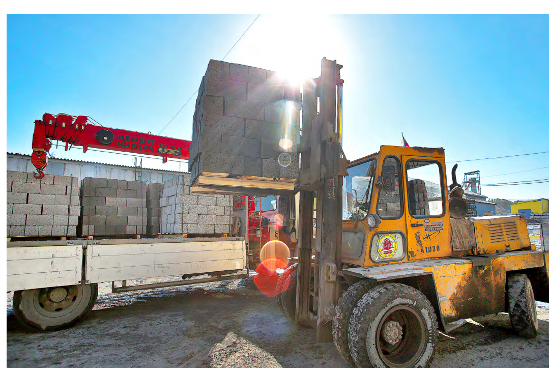
Склад готовой продукции цеха блоков. Отгрузка готовых изделий