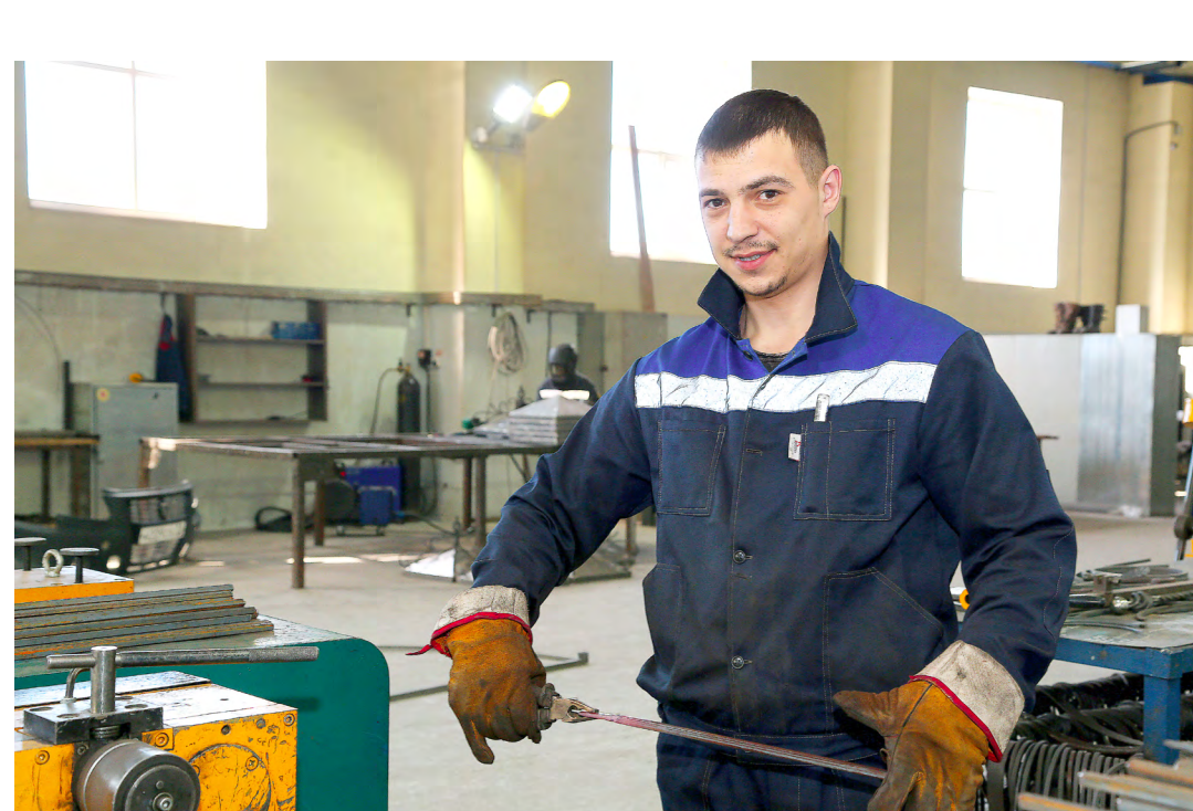
Цех металлоизделий. Подготовка металла для разогрева в кузнечной печи