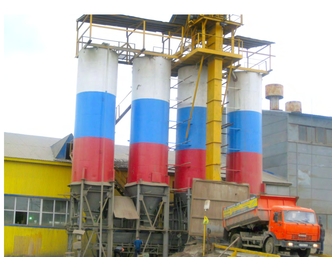
Цех блоков. Склад инертных материалов. Загрузка керамзита в приемный бункер