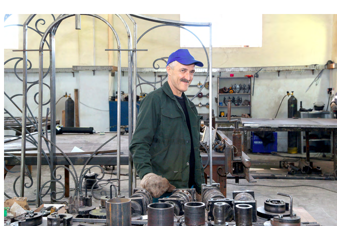
Цех металлоизделий. Гибочный станок «улитка» для изготовления витых заготовок