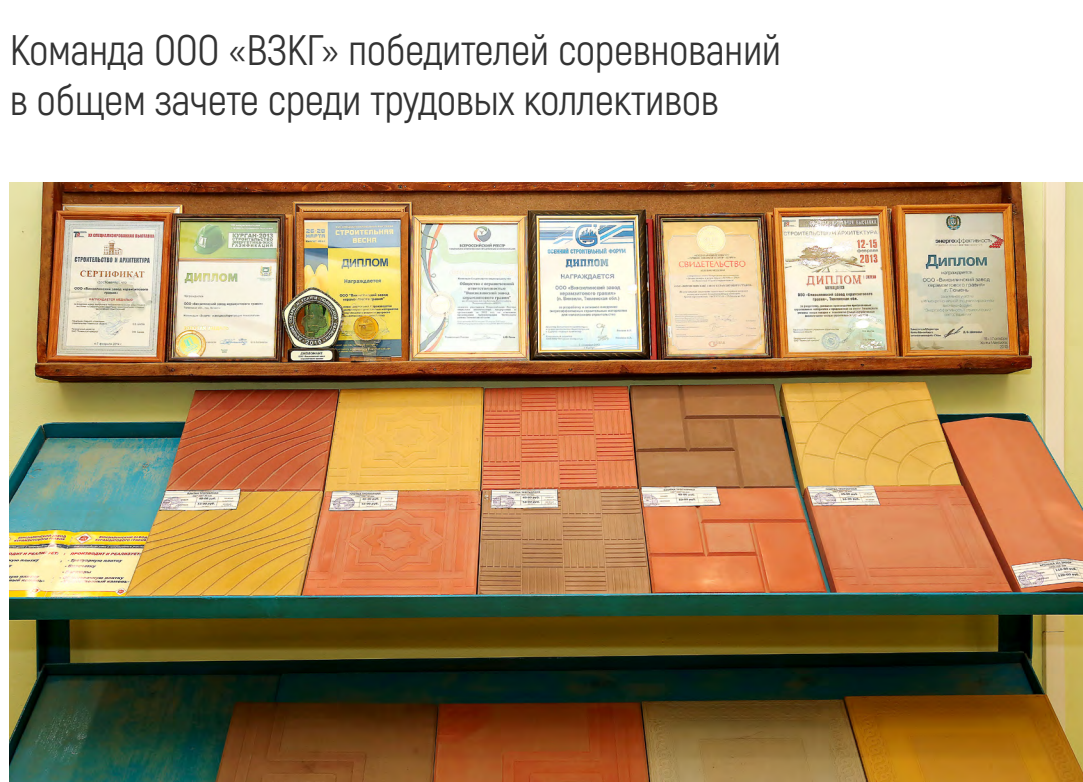
Выставочный зал продукции ООО «ВЗКГ». Изделия участка по производству плитки