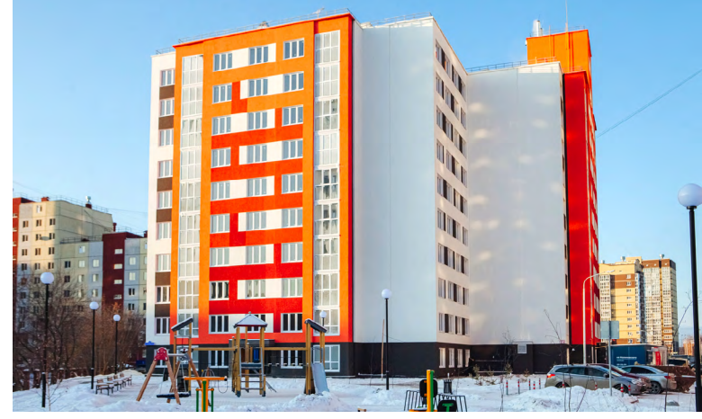
Дом на Малиновского