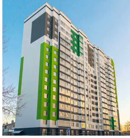
Дом на Буденного