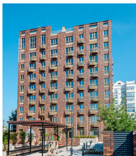
Дом бизнес-класса REAL