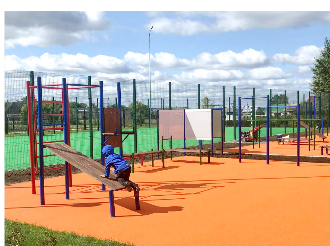
Школа в с.Тоболово Ишимского района. Малые архитектурные формы для выполнения норм ГТО

Финансовое состояние предприятия, его устойчивость и стабильность зависят от результата его производственной, коммерческой и финансовой деятельности. Устойчивое финансовое положение, в свою очередь, положительно влияет на объемы основной деятельности, обеспечение нужд производства необходимыми ресурсами для выпуска качественного продукта, востребованного потребителем. Качество и сроки выполняемых работ — визитная карточка ОАО «Ишимагроstroy», обеспечивающая стабильность предприятия строительного комплекса региона.