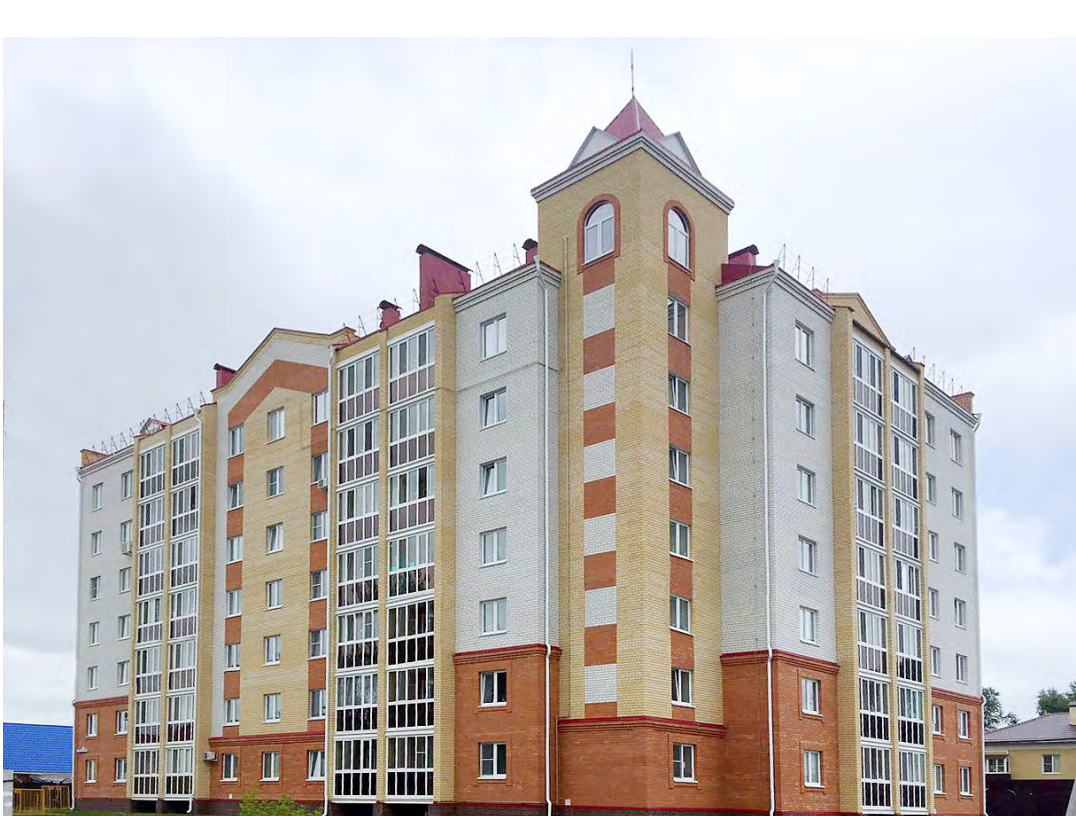
Дом по ул. Максима Горького, г. Ишим