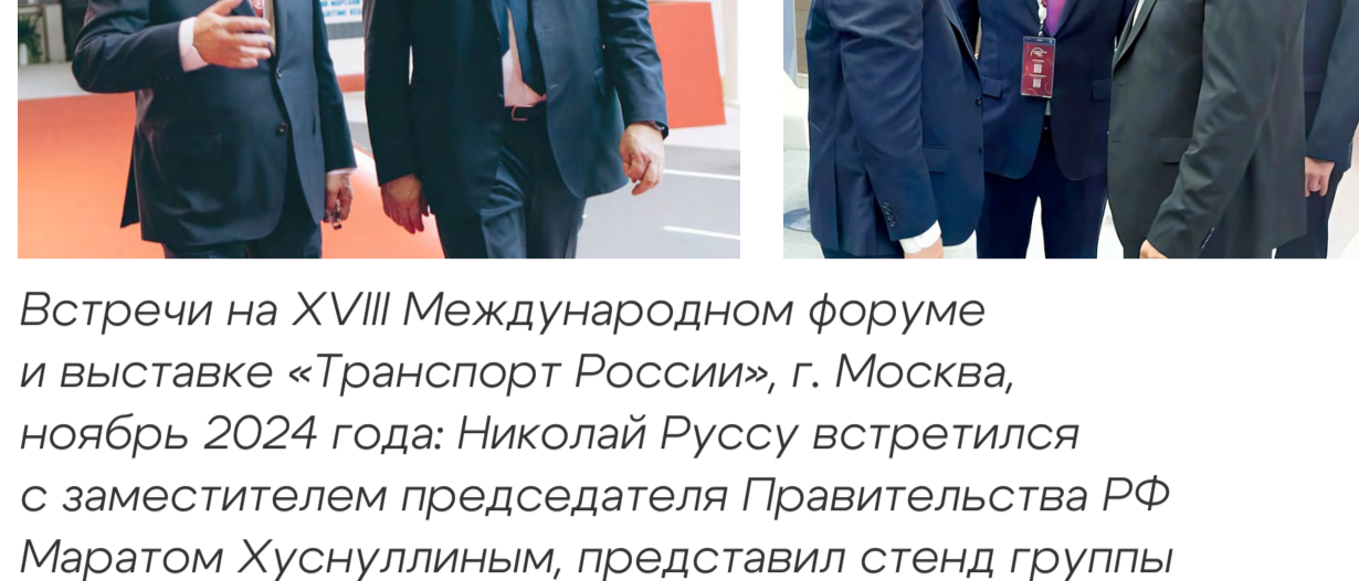
Встречи на XVIII Международном форуме и выставке «Транспорт России», г. Москва, ноябрь 2024 года: Николай Руссу встретился с заместителем председателя Правительства РФ Маратом Хуснуллиным, представил стенд группы компаний «Нацпроектстрой» полпреду Президента РФ в УрФО Артёму Жого и губернатору ХМАО — Югры Руслану Кухаруку