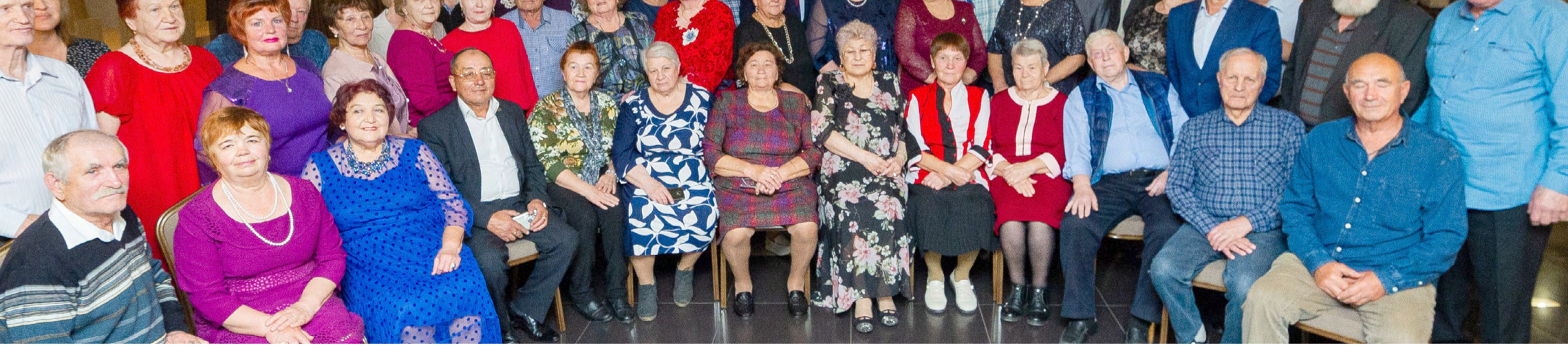
Встреча ветеранов-мостостроителей на День пожилого человека, г. Тюмень, октябрь 2024 г.