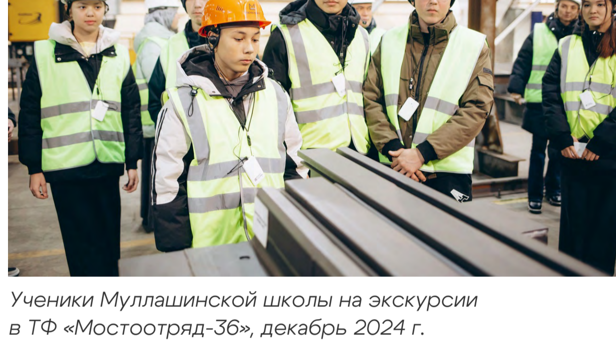
Ученики Муллашинской школы на экскурсии в ТФ «Мостоотряд-36», декабрь 2024 г.