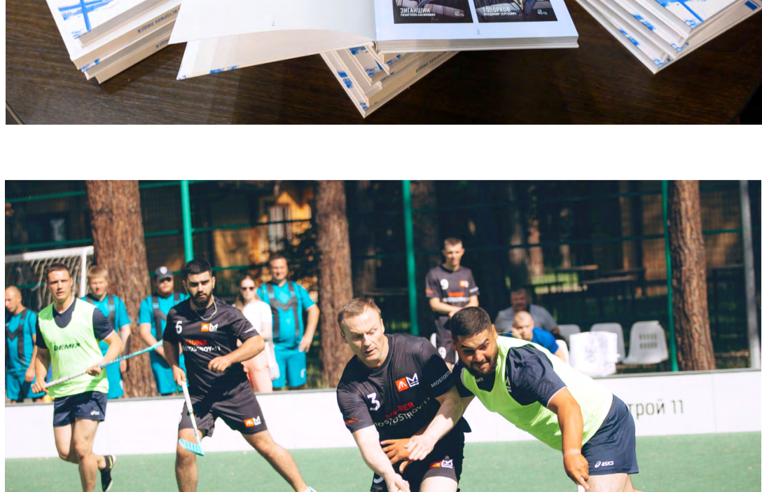
Руководство компании поддерживает спортивный дух коллектива: ко Дню строителя и под Новый год проводятся спартакиады по различным видам спорта

К юбилею ТФ «Мостоотряд-36» издана книга с воспоминаниями ветеранов о работе в отряде, которая была подарена героям очерков, а также передана в библиотеки школ, чтобы стать неким для выбора профессии