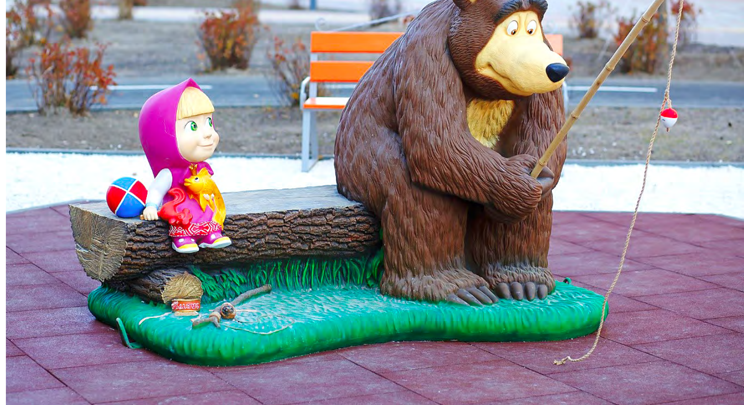
На территории Бульвара «Сказочный» расположены 21 сказочная скульптура