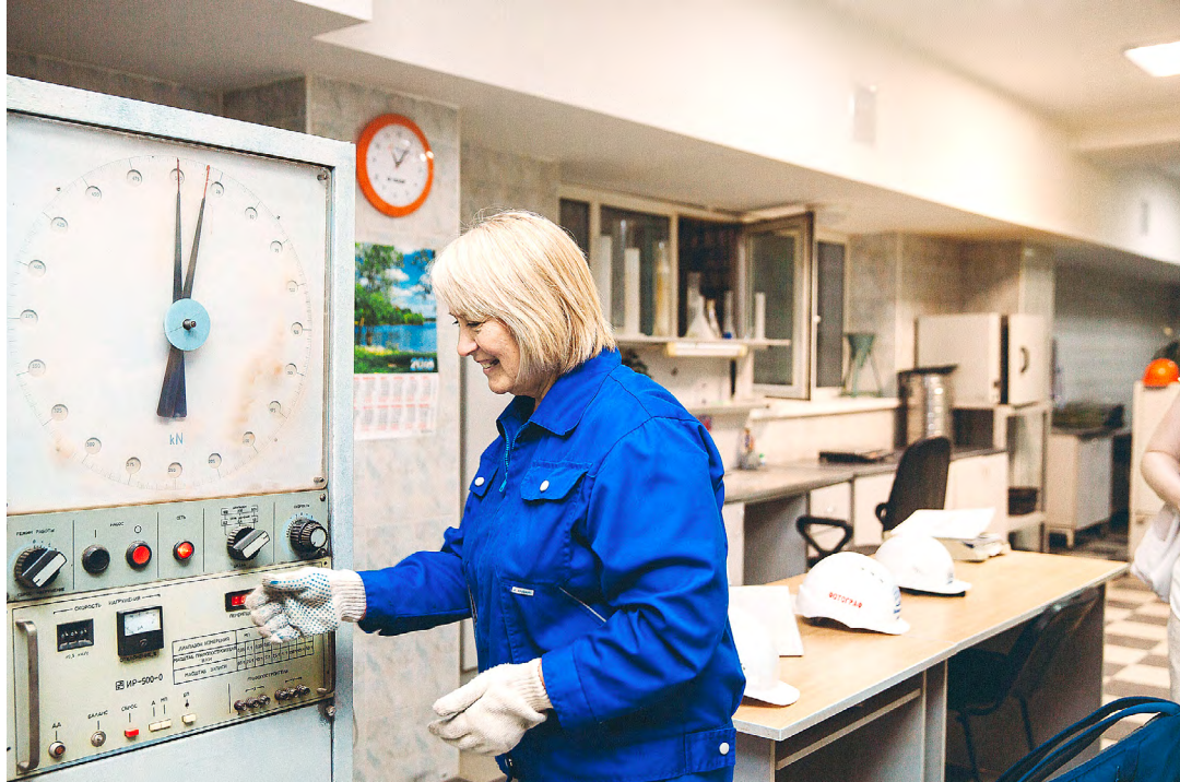
Собственная лаборатория на территории имущественного комплекса ОАО «ТДСК»