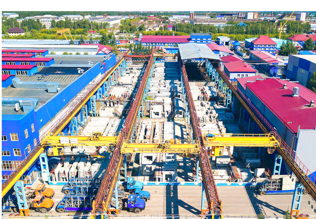
Площадь производственной базы ОАО «ТДСК» – 208 627 м²