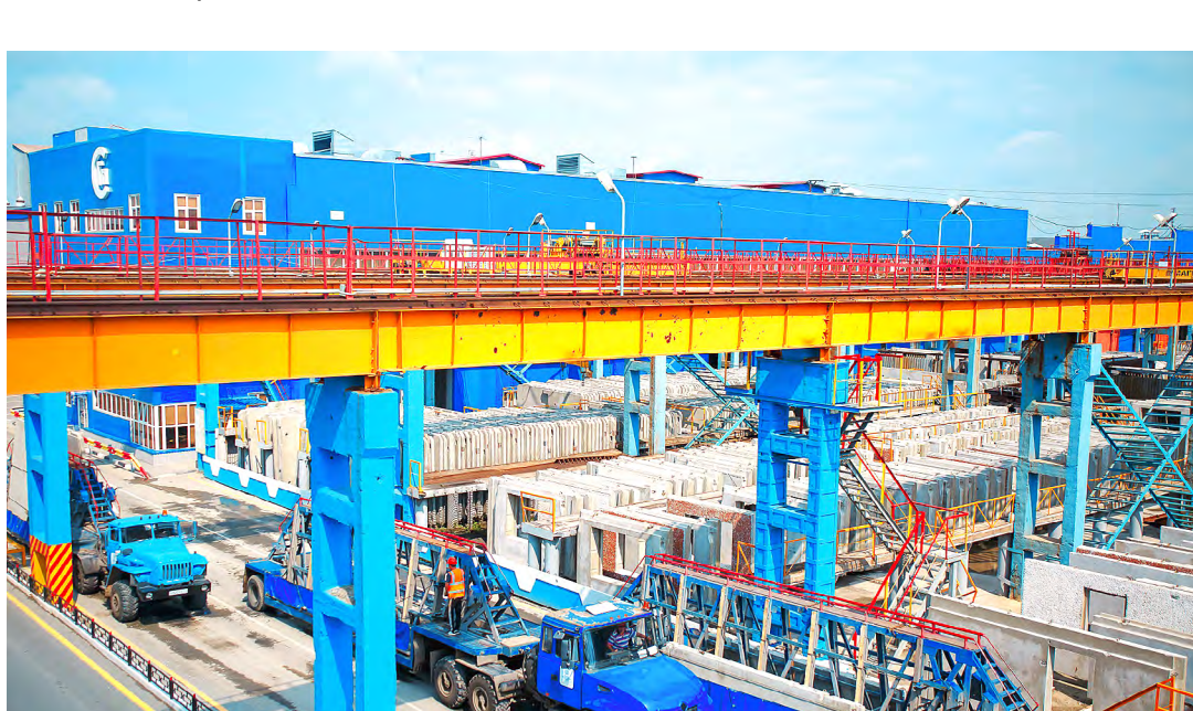
Собственный автопарк насчитывает 225 единиц техники