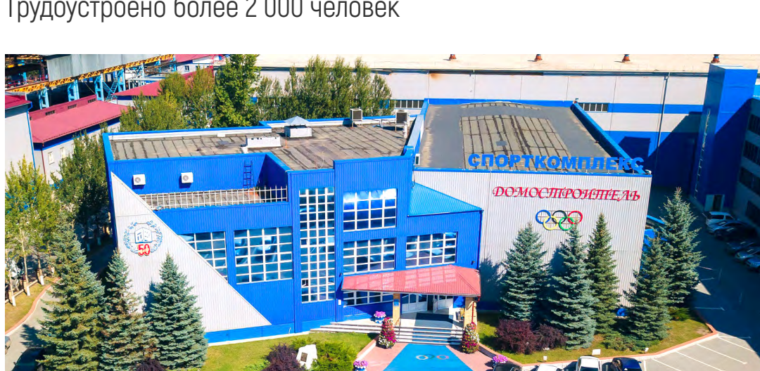
ФОК «Домостроитель» на территории ОАО «ТДСК»