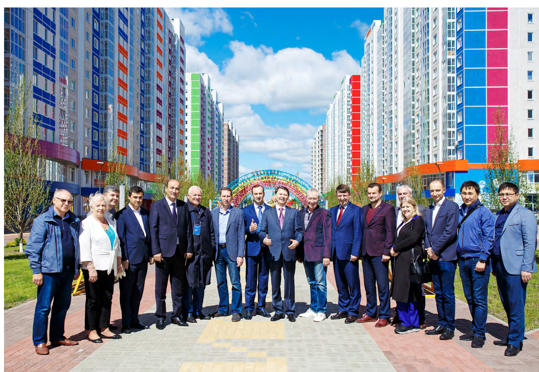
Презентация комплексного освоения территории в ЖК «Ново-Патрушево» для министров

Способ реализации жилья – договоры купли-продажи