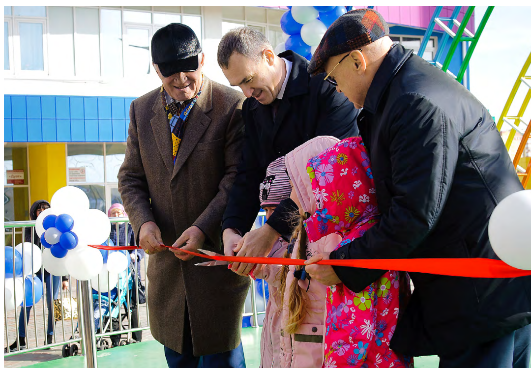
Открытие бульвара «Сказочный» в ЖК «Ново-Патрушево»