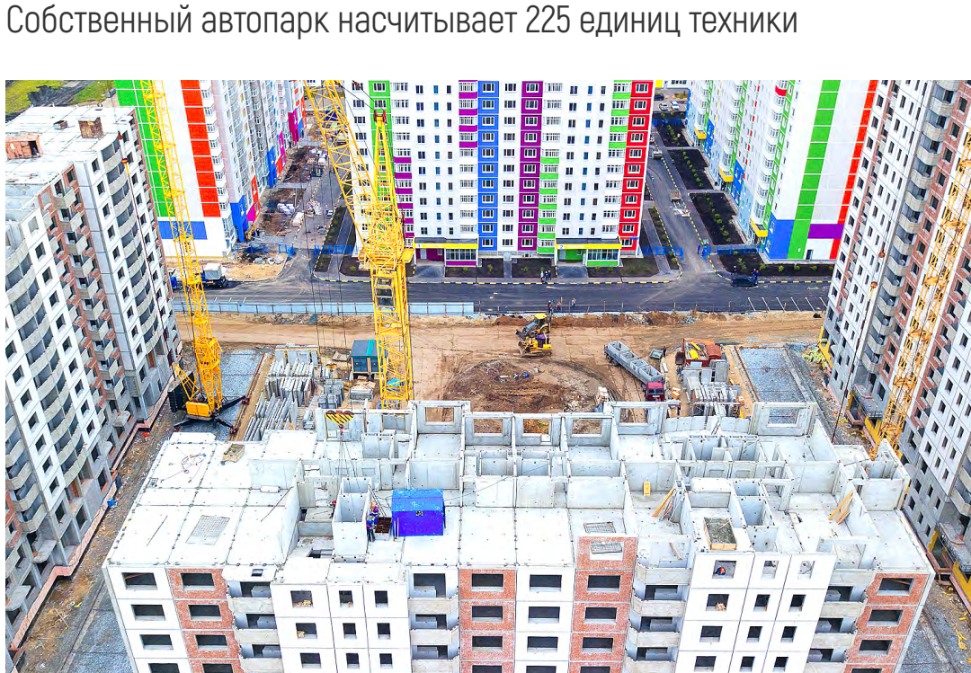
Трудоустроено более 2 000 человек