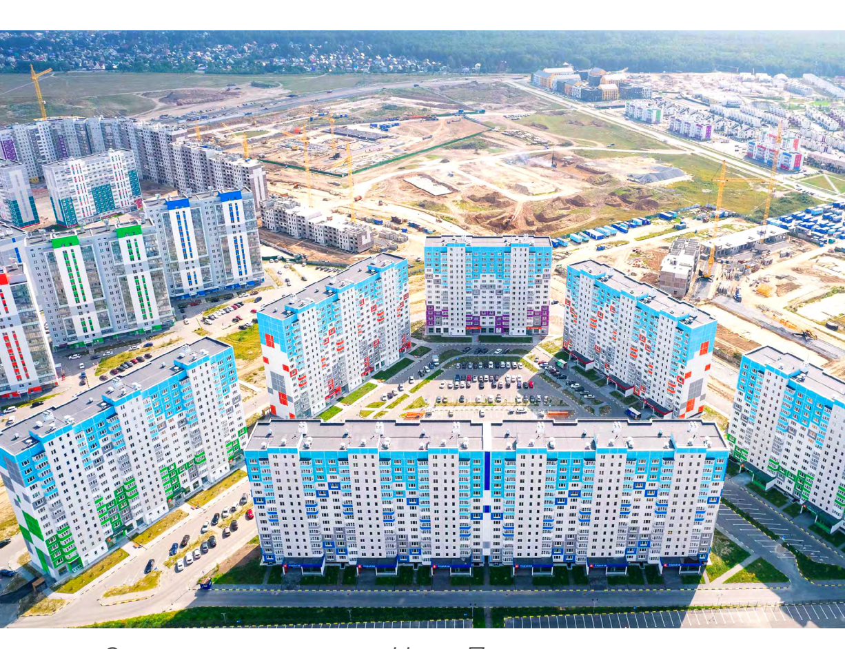
Освоение территории Ново-Патрушево