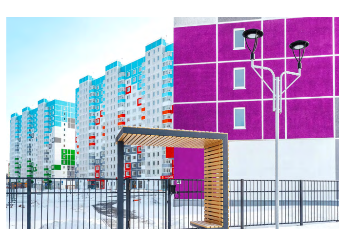
Благоустройство дворового пространства

По итогам 2021 года Программа АО «ТДСК» по строительству и вводу объектов выполнена на 100%. Плановый показатель производительности труда по компании выполнен на 118%. Программа модернизации заводских технологий и автоматизации систем управления в отчётном году также выполнена. На предприятии высокий уровень организации производственных и строительных процессов, высококвалифицированный персонал управленцев, подтверждённая безопасность и безопасность труда и упорядоченная система управления качеством. Всё это — безусловная заслуга коллектива АО «ТДСК» под руководством Николая Игнатьевича Щепелина.