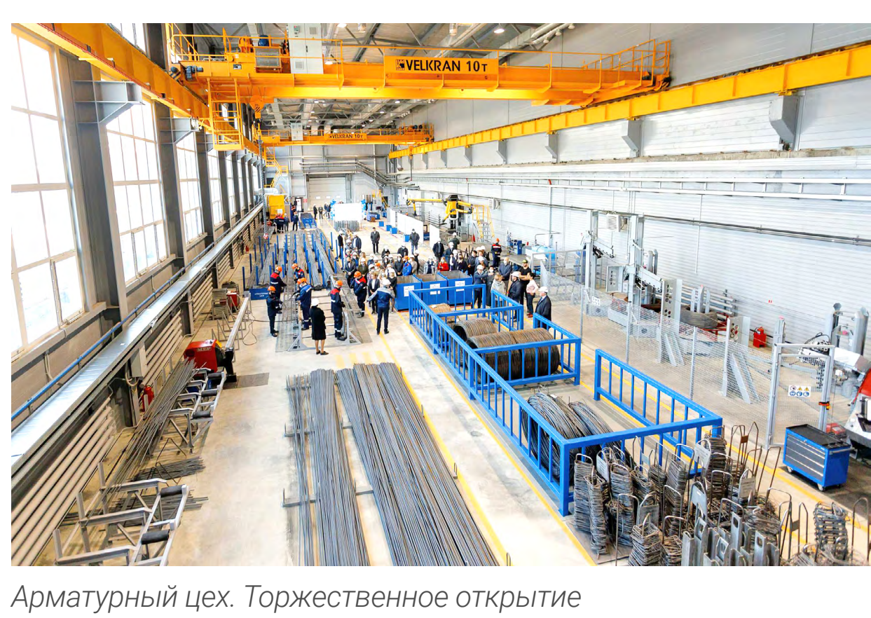
Арматурный цех. Торжественное открытие