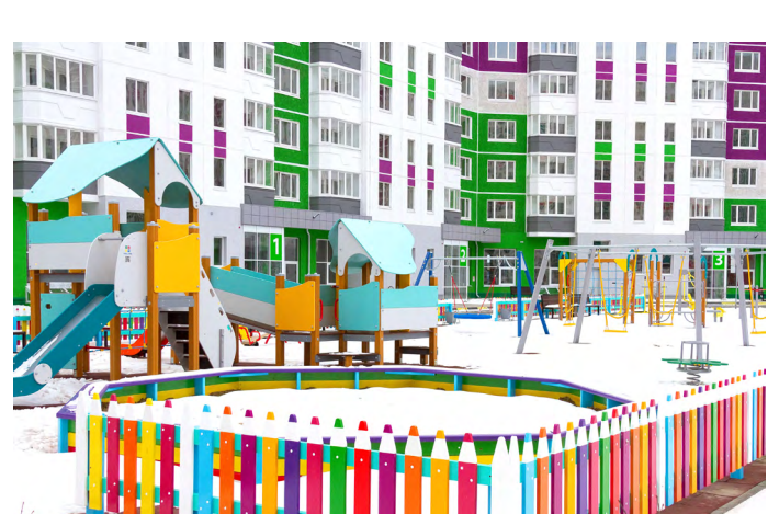
Благоустройство двора в Ново-Патрушево