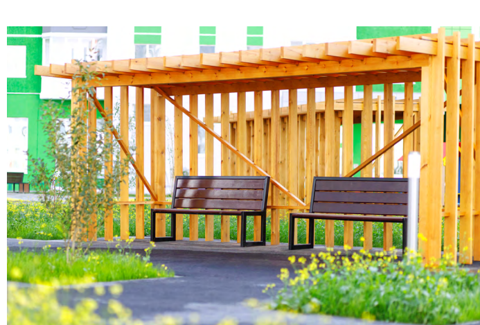
Зонирование дворовых пространств. Зона отдыха