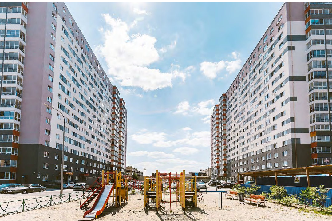
«Жуков» — жилой комплекс из трех жилых домов. Проект с собственным паркингом