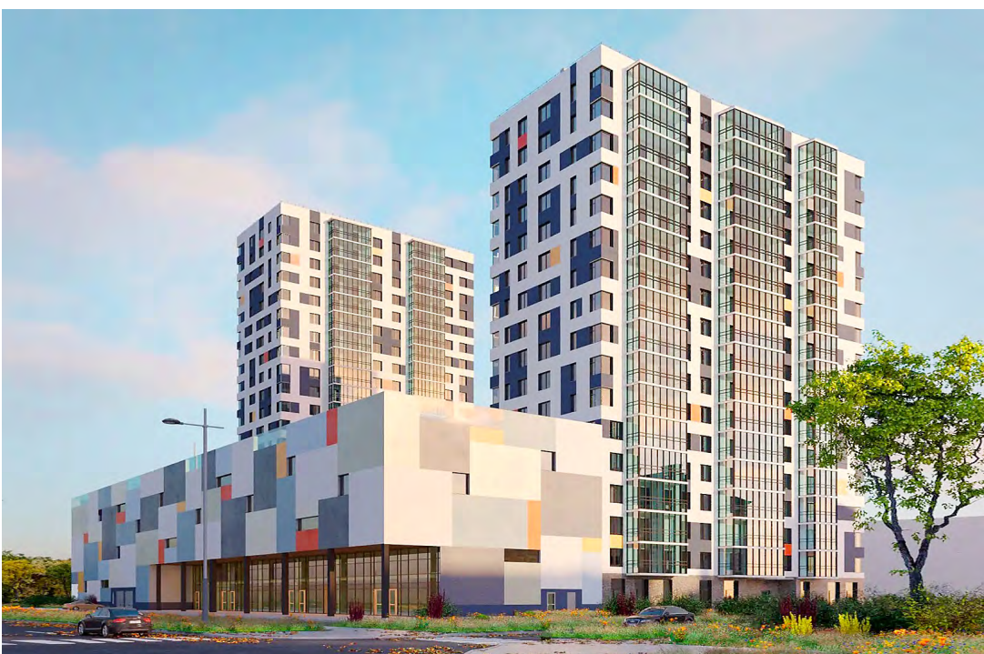
ЖК «Сити Дзен». Проект

Проекты ЮИТ отличаются комплексным, тщательно продуманным подходом к созданию благоприятной жилой среды и развитию городов в целом. Примечательно, что жилые комплексы «Финский залив» и «Жуков» — это успешные проекты редевелопмента бывших промышленных территорий, превращаемых в современные, по-европейски комфортные городские пространства.