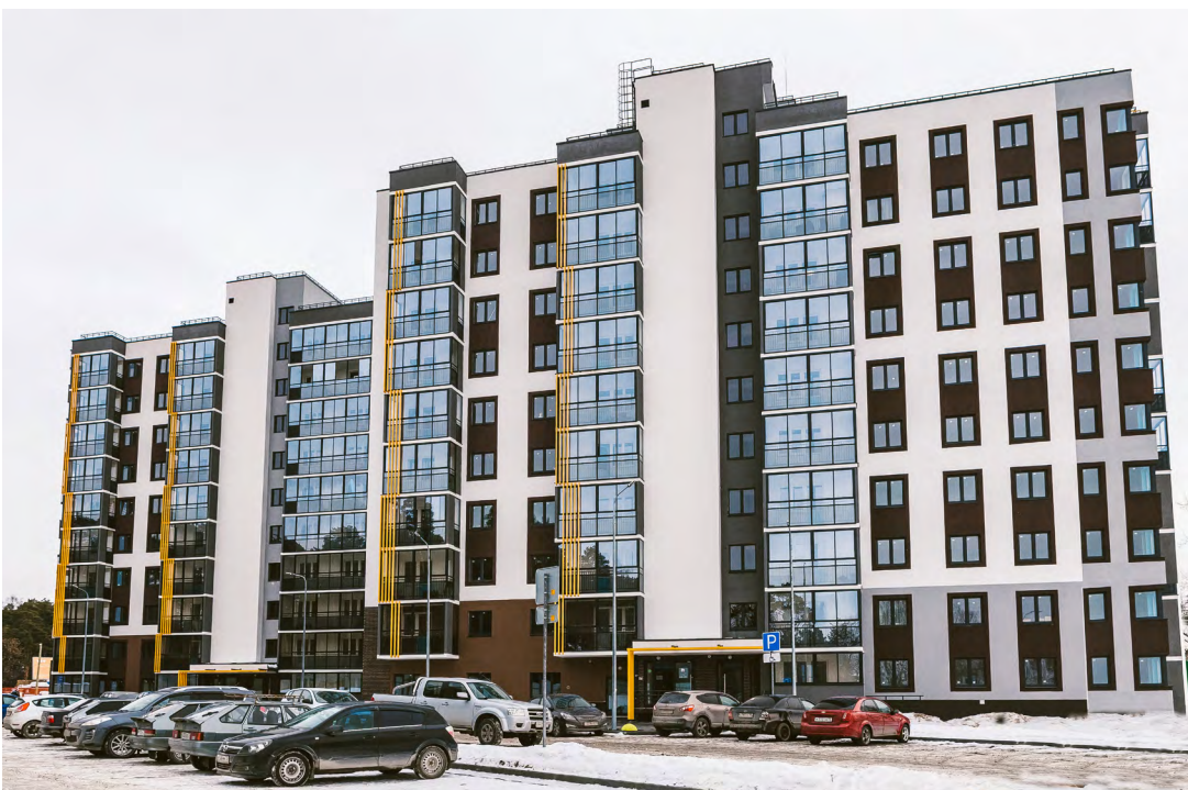
ЖК «Финский Залив» — проект ЮИТ в Тюмени. Река и большой парк с елями и соснами

Филиал АО «ЮИТ Санкт-Петербург» в Тюменской области — дочерняя компания финского строительного концерна «ЮИТ» была открыта в Тюмени в 2016 году. Однако история ЮИТ в Западной Сибири началась еще в 90-х годах, когда концерн, стремясь участвовать в модернизации освоения нефтяных запасов Западной Сибири, создал тюменское региональное представительство «ЮИТ-Юхтюма». Компания занималась поставкой готовых зданий: жилых домов, гостиниц, общежитий, домов культуры, магазинов, пекарен, холодильников, систем водоснабжения и очистных сооружений. Позднее жилищным строительством в городе стало заниматься екатеринбургское подразделение концерна «ЮИТ Уралстрой», пока не было принято решение основать отдельную компанию.