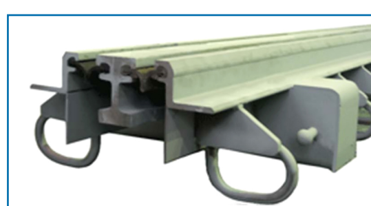
Производство деформационных швов: совместное российско-германское предприятие ООО «МАУЭР-МОСТОСТРОЙ-11»