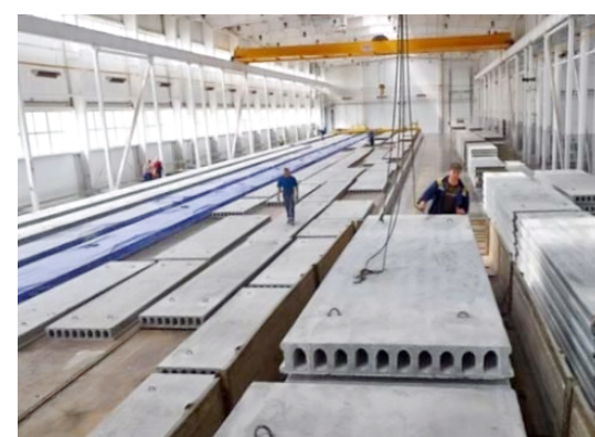
Цех стенового формования железобетонных конструкций типового и индивидуального проектирования