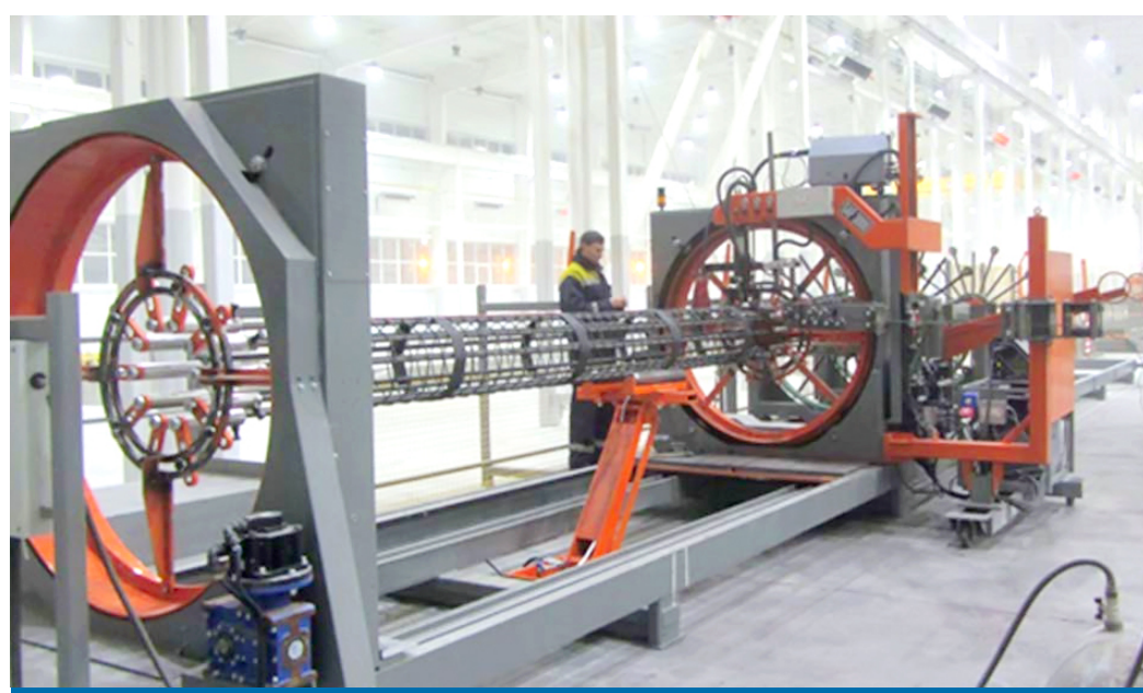
Цех арматурных изделий