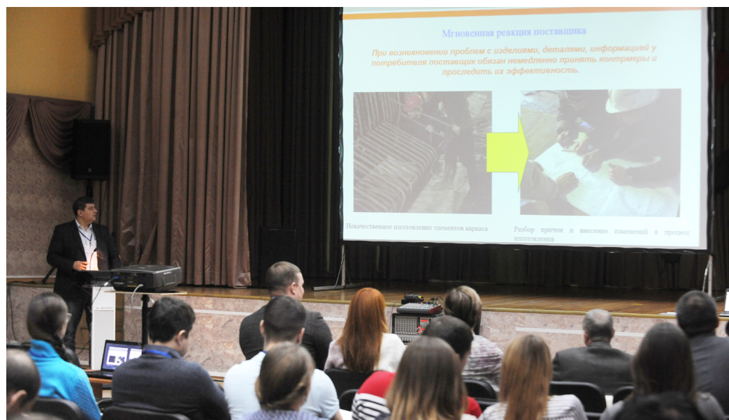
Конференция молодого специалиста